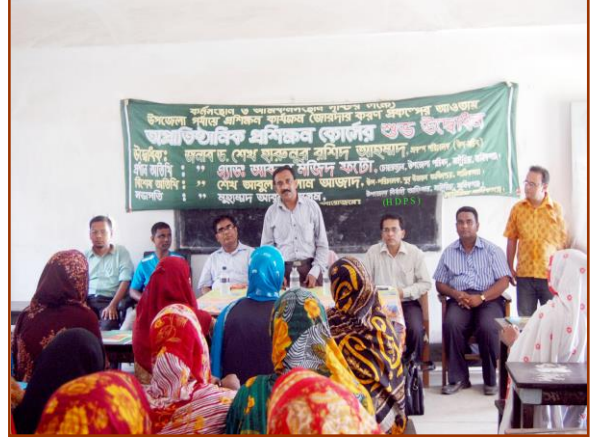
(গ্রাম ও অফিস পর্যায়ে সেমিনার ও প্রশিড়াণ)